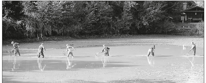
Abfischen der Fische beim Ablassen