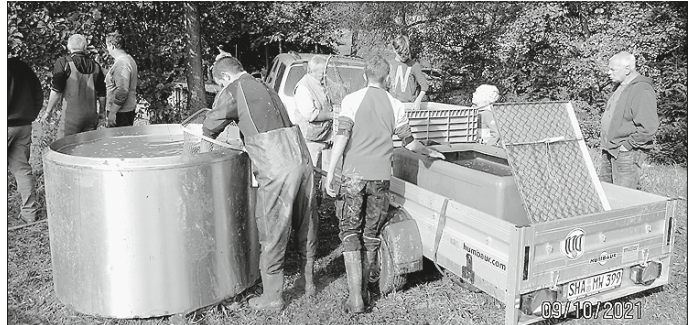
Transport der Fische nach Seehölzle