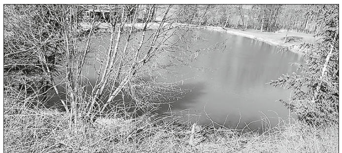
Überblick nach Fertigstellung und Anstau