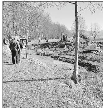
Schlammnahme mit 2 Baggern der Fa. Haag