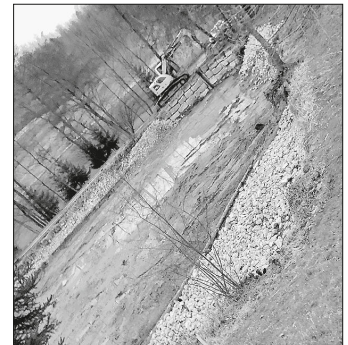
Ufersicherung i.V. mit angelegten Flachwasserzonen und Biotop