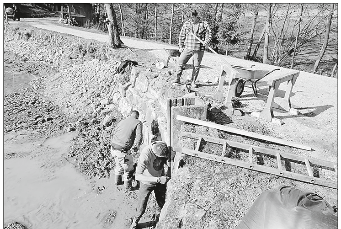
Ausfugen des Damms am Mönch mit Beton sowie Steinen