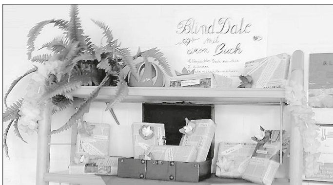
Blind Date mit einem Buch