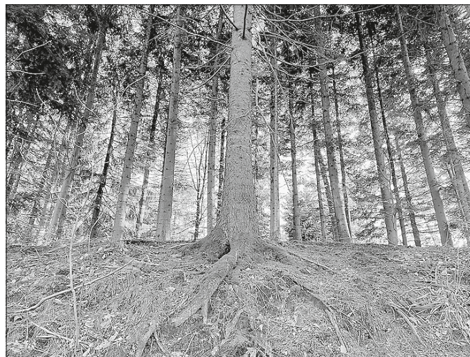
„Starke Wurzeln, starke Menschen“ – Packst du mit uns die Zukunft des Schwäbischen Waldes an der Wurzel?

Der Link zur Online-Umfrage sowie alle Infos zur Region, zur Neubewerbung und zu den Mitmachmöglichkeiten sind auf www.leader-schwaebischerwald.de/neubewerbung zu finden.