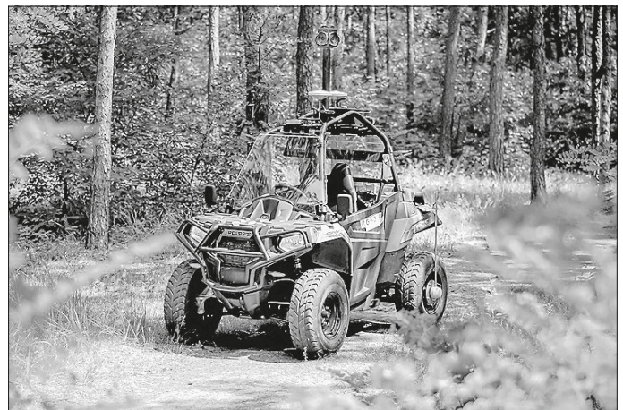
600 Kilometer Radwege werden bei der Zustandserfassung im Landkreis Schwäbisch Hall abgefahren. Dies erfolgt mit einem ähnlichen Fahrzeug wie diesem hier.

Das „Kreisradnetz Alltag“ umfasst insgesamt rund 950 Kilometer im Landkreis. Teilweise können aber Daten aus anderen Untersuchungen genutzt werden (z. B. ZEB Kreisstraßen, ZEB Radwege an Bundes- und Landesstraßen). Deshalb werden bei der Befahrung insgesamt rund 600 km des Alltagsstreckennetzes erfasst. Neben der Befahrung im Juni 2023 wird es auch im August 2023 noch einmal eine Zustandserfassung geben.