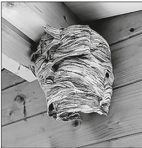
Ein Hornissennest in einem Gartenhäuschen.