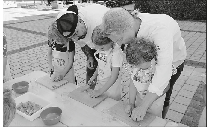
Naturpark SFW, Die Kinder haben sichtlich Spaß beim Aktions-tag mit der Naturpark-Kochschule

dergarten ist das ein wirklich tolles Angebot, über das wir uns sehr gefreut haben“. Die beiden Einrichtungen Stubener- und Schladminger Weg wurden in diesem Jahr als Naturpark-Kindergarten ausgezeichnet.