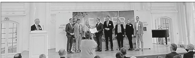
Im Neuen Schloss in Stuttgart wurden die erfolgreichen LEADER-Regionen verkündet.

In den nächsten fünf Jahren haben somit 27 der 30 Kreisgemeinden des Landkreises Schwäbisch Hall die Möglichkeit, in den Genuss einer LEADER-Förderung zu kommen.